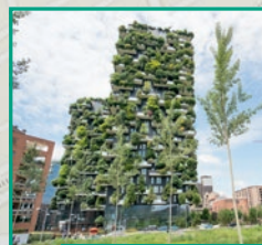
Une tour bioclimatique

La préservation des joyaux historiques ouverts au public (chapelle du Refuge, apothicaire).