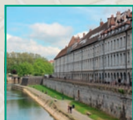
Les berges du Doubs embellies

Une vision ambitieuse et globale pour un centre-ville qui rayonne sur l'ensemble de la communauté urbaine et la Région.