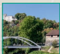
Le Parc des Deux Rives